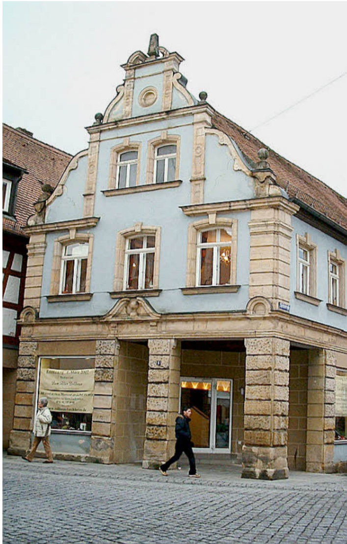
Das „Alte Zollhaus“ von außen.

In der Hauptstraße 4, gleich beim ehemaligen Krankenhaus, öffnet mit dem Monatswechsel das Restaurant „Zum Alten Zoll-